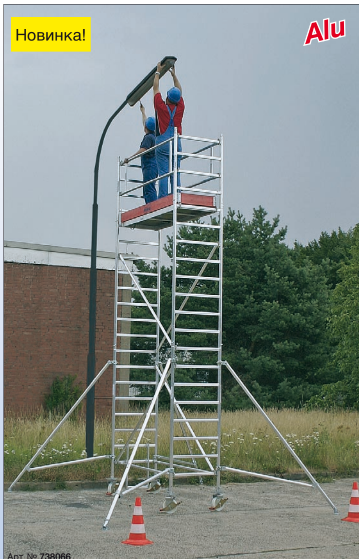
Арт. № 738066

Важно: необходимость применения балласта (дополнительное оснащение) зависит от варианта конструкции. Данные по балластам приведены в инструкции по применению и монтажу, а также на нашем сайте в интернете.