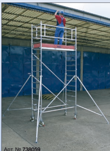
Арт. № 738059